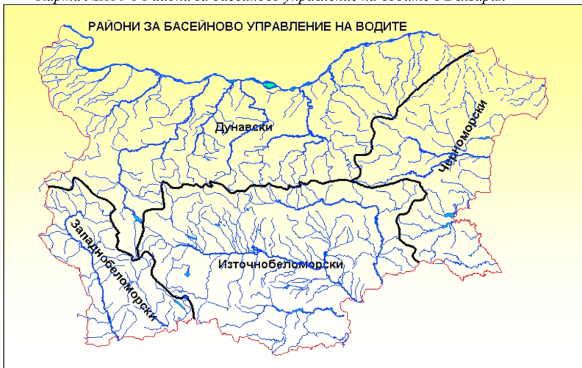
Карта №А10-1 Райони за басейново управление на водите в България

За управление на принципа на речните в басейни в РБългария са определени четири района за речно басейново управление.